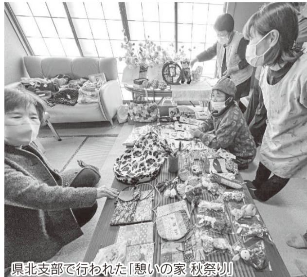
県北支部で行われた「憩いの家 秋祭り」

第一の柱は、組合員さんの活動参加の輪を広げることです。「支部のたまり場」「あそび健康相談会」「グラウンドゴルフ」などの取り組みは、誰でも参加できる大切な居場所です。「ちよつと顔を出してみよう」から始まり、顔見知りになり、やがて声をかける側になる。その関わりが広がります。生協の力です。毎回参加できなくても、その活動の積み重ねこそが地域の支え合いを生みます。今年度は、こうした「気づいたら仲間になっていた」という参加の輪をさらに広げていきます。