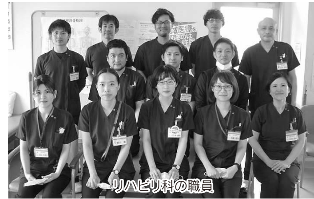
リハビリ科の職員