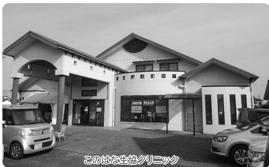
このはな生協クリニック