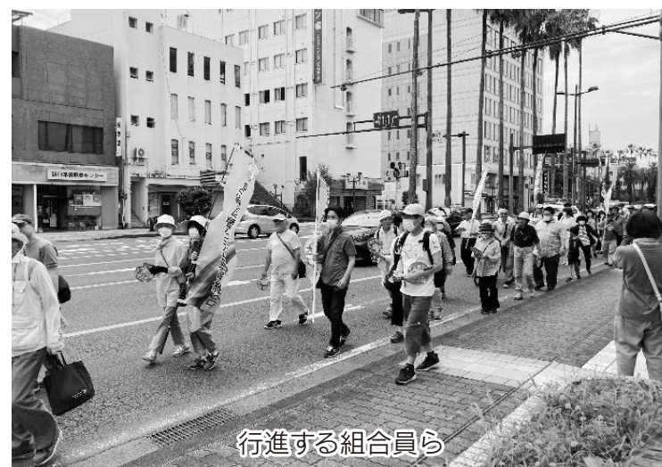
行進する組合員ら

熱中症の予防として、まずは暑さを避けることが大事になります。暑い日には無理な外出を控える、屋内でもエアコン・扇風機を適切に使う、屋外では日傘を使うなどが効果的です。次に大事なものは、水分をこまめに補給することです。暑い日にはのどが渇いたと感じる前から、お茶やスポーツ飲料などで水分を補給しておきましょう。お酒は尿として出ていく水分を増やしてしまうため、水分補給としては飲まないようにしましょう。