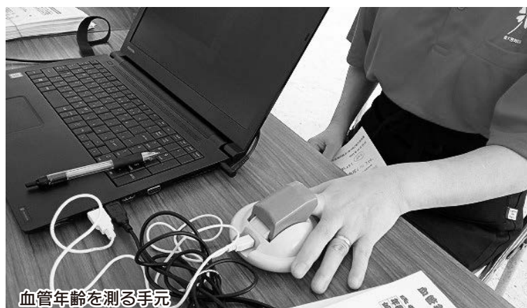
血管年齢を測る手元

10月16日(日)、宮崎市立東大宮中学校で防災フェスティバルが開催されました。このイベントは東大宮地域まちづくり推進委員会が主催となり、「いつ起こるかわからない災害に備えて」をテーマで開催しました。当日は様々な催しがあり、宮崎市消防局による消火訓練やバス展示、各団体によるドライシャワー体験や非常食の配布などが行われました。 宮崎医療生協からは健康まちづくり部が参加し、来場者の血圧と血管年齢のチェックを行いました。当日は151人の方が訪れ、「今日は血圧が安定して安心したわ」「血圧の薬を飲むのを忘れるとやっぱり高いね」「え!?こ