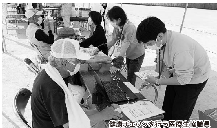
健康チェックを行う医療生協職員

10月16日(日)、宮崎市立東大宮中学校で防災フェスティバルが開催されました。このイベントは東大宮地域まちづくり推進委員会が主催となり、「いつ起こるかわからない災害に備えて」をテーマで開催しました。当日は様々な催しがあり、宮崎市消防局による消火訓練やバス展示、各団体によるドライシャワー体験や非常食の配布などが行われました。 宮崎医療生協からは健康まちづくり部が参加し、来場者の血圧と血管年齢のチェックを行いました。当日は151人の方が訪れ、「今日は血圧が安定して安心したわ」「血圧の薬を飲むのを忘れるとやっぱり高いね」「え!?こ