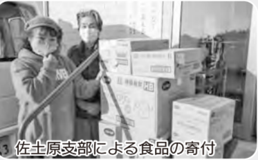
佐土原支部による食品の寄付

変更していただく食品は必ず事前に確認してください。お問い合わせ先までご連絡ください。