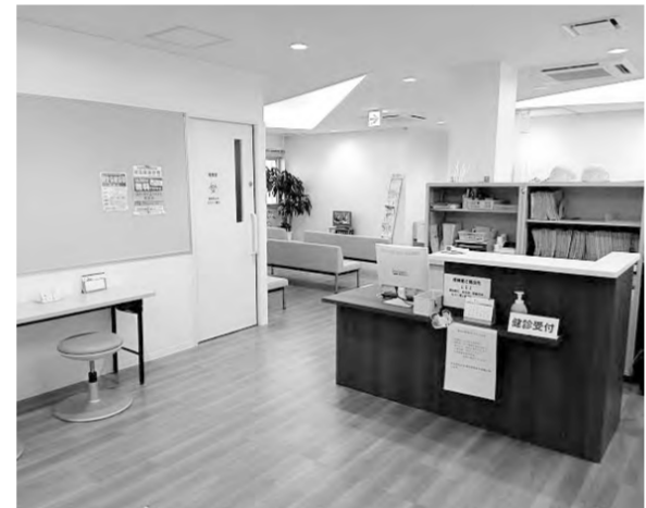
宮崎生協病院 健診科