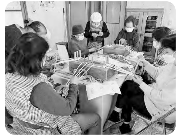
『布草履づくり教室の様子』

生協クリニックのべおかに隣接している施設だけに、医療生協の各事業所との交流も進み、協調関係も発展するものと期待をしています。これからの計画はバザーやカフェ、班に所属していない組合員さんを対象としたフリー班会などが計画されていますので、今後ますますにぎやかな場所になりそうです。こうした活動を通して利用者の皆さんの生活にメリハリが付き、いきいきと過ごせる場所として多くの皆さんに利用してもらえるよう認知の向上に努めていきたいと思っています。