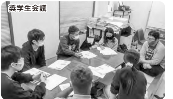
宮崎大学医学科に在籍する奨学生は、毎月奨学生会議「てのひら会」に参加します。宮崎医療生協の医師とともに自主的な学習や交流を深めます。

これらの奨学金制度は、宮崎医療生協の病院や診療所、介護施設をご利用いただいている組合員さんの出資金が支えとなって運営しています。ご家族やご親戚、お知り合いで宮崎での医療や介護の道を志す学生さんの紹介にご協力いただければ幸いです。