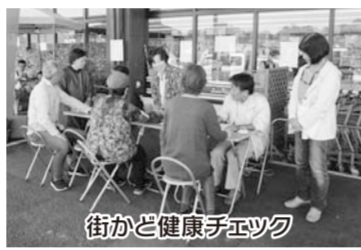
街かど健康チェック

宮崎生協病院の地元支部として、在宅療養患者さん宅への七夕飾りや介護施設への訪問、コピーみやぎき柳丸店での健康チェックなど、いろいろなボランティア活動を行い、地域の方々とのお出合いがたくさんでまします。また、健康まつりやバスハイクなどに取り組み、組合員さんとの交流も深まり、組合員増やしと出資金増殖は目標を達成しました。