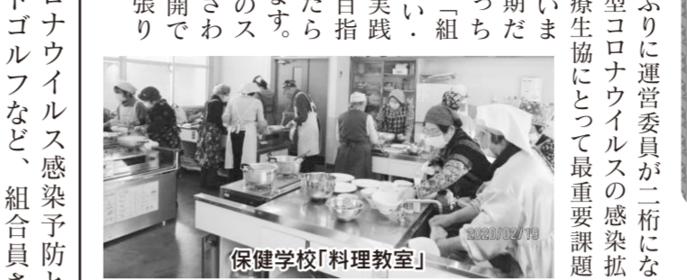
保健学校「料理教室」

今期は久しぶりに運営委員が二桁になりました。新型コロナウイルスの感染拡大防止は、医療生協にとって最重要課題と受け止めて、こんな時期だけに「独りぼっちを作らない」「組合員の助け合い、絆を強く」を実践できる支部を目指して活動できたと思います。新体制で支部のスムーズに展開できるように頑張りたいです。