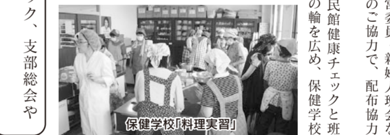
保健学校「料理実習」

去年、全国四課題の出資金増資では、増資袋を活用し多くの組合員さんのご支援で、目標を大きく達成することができました。担い手づくりでは、地域の地図おとしをして機関紙配布増数、また職員・元運営委員・新婦人班会など多くの皆さんの協力で、配布協力員も増えました。