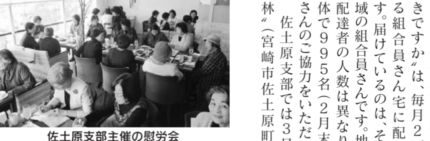
佐土原支部主催の慰勞会

宮崎医療生協の機関紙「おげんきですか」は、毎月2万人を超える組合員さん宅に配られています。届けられているのは、それぞれの地域の組合員さんです。地域によって配達者の人数は異なりますが、全体で995名(2月末)の組合員さんのご協力をいただいています。佐土原支部では3月27日、空林(宮崎市佐土原町下那珂)で慰勞会を開催しています。宮崎医療生協の組合員さんの総数は約5万5千名です。おげんきですかの配布数は約2万5000部と、4割の組合員さん宅に届けられているのが現状です。ご近所の組合員さん5軒程度なら「ウォーキングを兼ねていよ」などの配布協力組合員さんを募集しています。宮崎医療生協組織部(0985-319055)までご連絡ください。