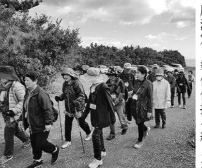
潮騒聴きながら健康ウォーク

医療生協のスローガン「健康なまちづくり」を目指すには、自分の「健康なからだづくり」が不可欠です。自身の健康状態を把握し、健康への関心を持つきっかけとして、まずは健康診断を受診しましょう。特定健診は、定期的に関心にかけている方でも受診できます。宮崎医療生協の「健康づくりセット」も、もちろん受診できます。受診案内や受診券が届いたら、宮崎生協病院または最寄りの各クリニックにお電話ください。宮崎生協病院健診科0985-24-6566(電話予約8:00-16:30)