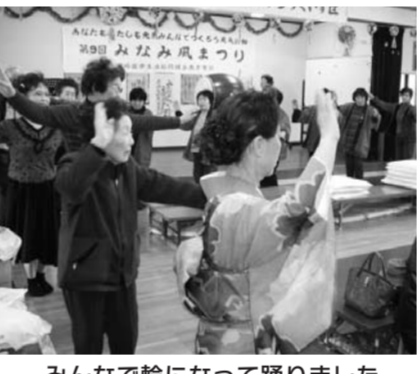
みなで輪になって踊りました

桜の開花も始まる3月18日(日)の良き日に、第9回なみ風まつりを開催しました。例年使用していた南方コンビティセンターは会場が使用料が有料のため、うぐいす団地公民館(延岡市西階町)で行いました。会場が今までと少し離れたことや参加者の高齢化、諸行事などが重なり、やや少ない50名の参加でした。毎回一番人気の「創作舞踊」を踊られる方が、体調不良で出演されませんでしたが、舞台は20組を超える方々で賑やかに、大盛り上がりでした。9時から12時までは演芸を、11時から12時30分までは初の試みで、ぜんざいの振舞いを行いました。当日は医療生協の組合員加入はなかつたものの、二安倍9条改憲NO!憲法をいかす全統一行動署名は、36筆集ま