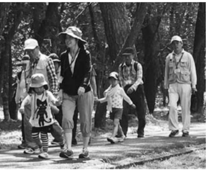
親子で楽しく健康ウォーキング

「親子で楽しく歩きました。また参加したいです」、「交通の便が良くて市民の森はすぐにわかりました」、「育児や相談などもしていただきありがたかったです」などの声が寄せられ、最後はみんな宝探しやじゃんけん列車などのゲームで楽しみました。企画の運営にご協力いただいた組合員さん、病院小児科スタッフのみなさん、心からお礼申し上げます。(健康づくり委員会 横山けい子)