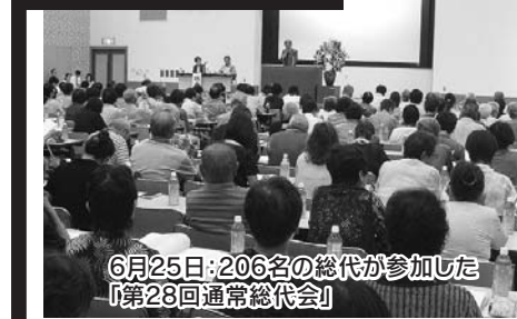
6月25日:206名の総代が参加した『第28回通常総代会』