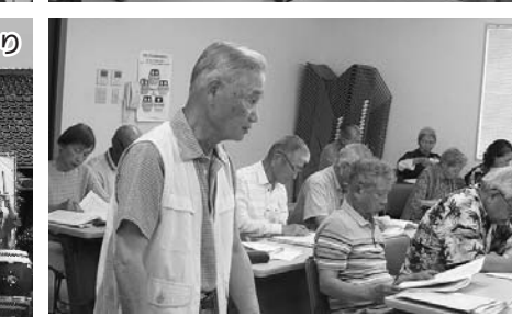
5月26日:宮崎中央ブロック総代会議(病院の取り組みや経営などの質問がでました)

その他 ◎4月20日～5月27日、17支部で支部総会を開催 ◎5月26日～6月2日、6つのブロックで区域別総代会議を開催 など