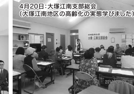
4月20日:大塚江南支部総会(大塚江南地区の高齢化の実態学びました)