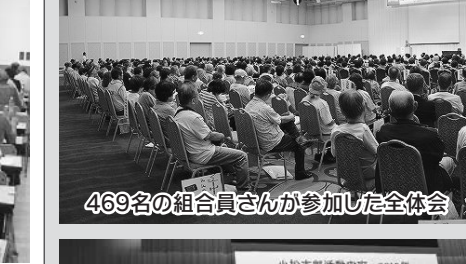
469名の組合員さんが参加した全体会