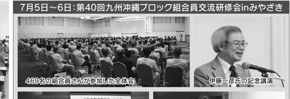
7月5日～6日:第40回九州沖縄ブロック組合員交流研修会inみやざき