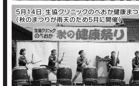
5月14日:生協クリニックのべおか健康まつり(秋のまつりが雨天のため5月に開催)