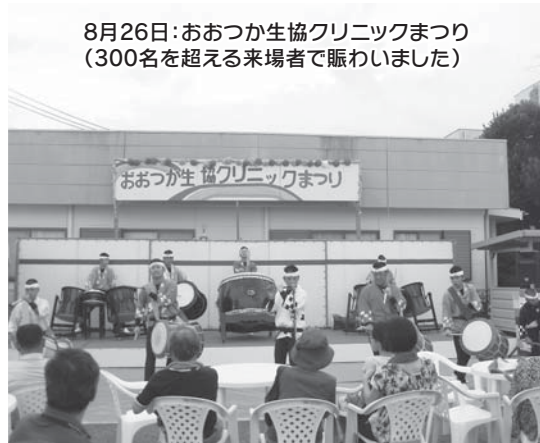
8月26日:おおつが生協クリニックまつり(300名を超える来場者で賑わいました)