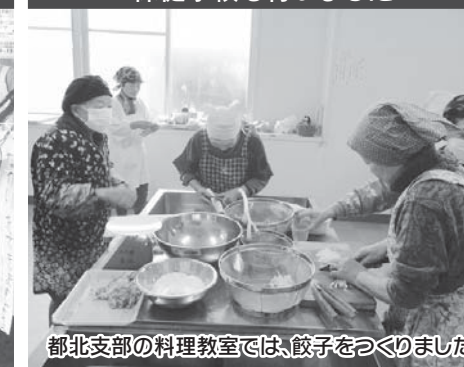
都北支部の料理教室では餃子をつくりました。