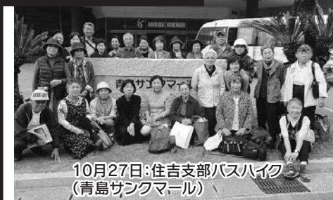
10月27日:住吉支部バスハイイク(青島サンクマール)