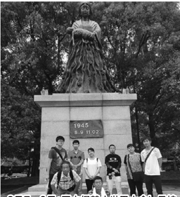
8月7～9日:原水爆禁止世界大会in長崎(組合員さん2名・職員7名が参加)