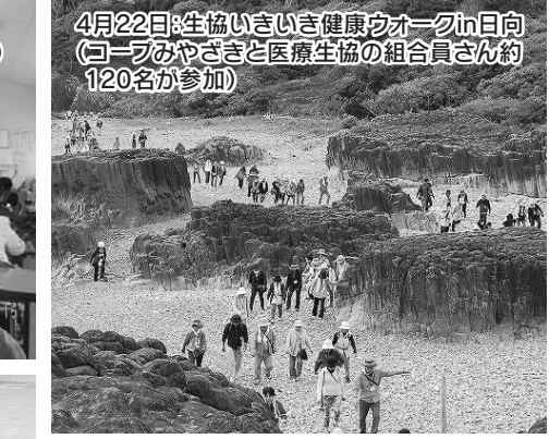
4月22日:生協いきいき健康ウォークin日向(コープみやざきと医療生協の組合員さん約120名が参加)