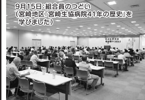
9月15日:組合員のつどい(宮崎地区「宮崎生協病院41年の歴史」を学びました)