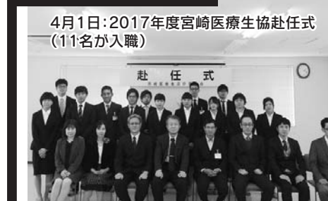
4月1日:2017年度宮崎医療生協赴任式(11名が入職)