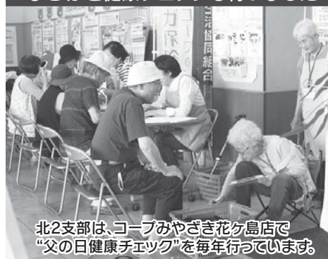
北2支部は、コープみやざき花ヶ島店で「父の日健康チェック」を毎年行っています。