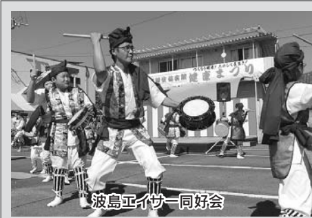
波島エイサー同好会