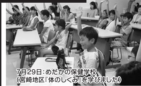
7月29日:めだかの保健学校(宮崎地区1体のしくみを学びました)