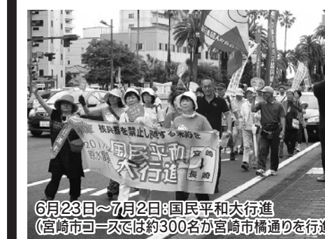
6月23日～7月2日:国民平和行進(宮崎市コースでは約300名が宮崎市橋通りを行進)