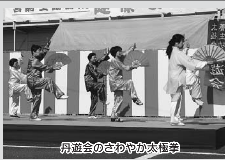
丹遊会のさわやか太極拳

◎「宮崎生協病院健康まつり」11月5日(日)、地域のみなさんの参加を含めて1,200名を超える来場者で賑わいました。 ◎中学生の吹奏楽演奏、園児の歌やダンス、エイサーや太極拳、ひよっこ踊りなどで会場は盛り上がりしました。