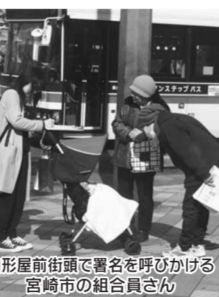
山形屋前街頭で署名を呼びかける宮崎市の組合員さん

【東北支部】東北支部では、2月14日恒例の医療生協バレンタイン行動を行いました。会場のコブみやざき浜町店に10名の組合員が参加して午後3時から1時間、「医療・介護の改善を求める署名」と「核兵器廃絶を求める国際署名」の二つの署名と血管年齢測定、体脂肪測定などの健康チェックを行いました。お客様からは、「血管年齢測定を受けたい」と思っていた、など喜ばれました。署名には、「保険料の引き上げなど負担が増えるばかりで大変」と不満を漏らしながら84筆と86筆の協力をいただきましたが、寒い中での1時間の行動としては上々の成果だったと思います。(東北支部 茄子田和哉)