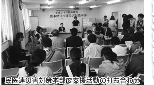
民医連災害対策本部で支援活動の打ち合わせ