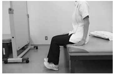
両足一緒につま先を上げます