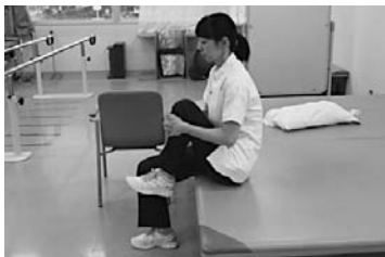
膝を胸へ引き寄せます