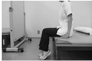
両足一緒に踵を上げます