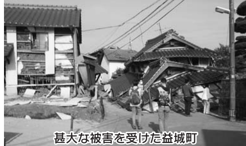
甚大な被害を受けた益城町

4月19日～21日の3日間、宮崎民医連・宮崎医療生協の支援第1陣として、熊本民医連の拠点病院である、くわみず病院熊本市中央区への医療支援と益城町などへの地域訪問行動などを行ってきま