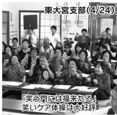
東大宮支部(4/24) 『笑い問には福来たる』笑いケア体操は大好評