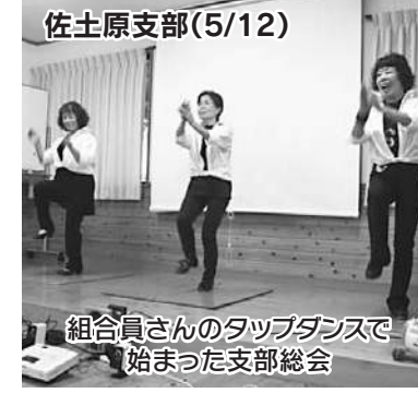
佐土原支部(5/12) 組合員さんのタップダンスで始まった支部総会