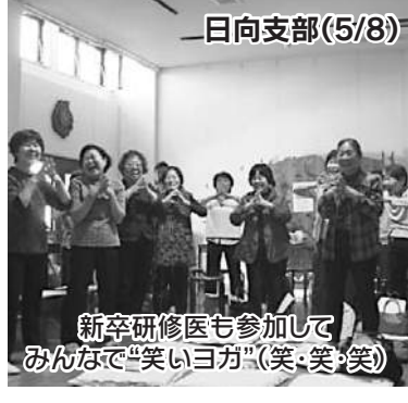
日向支部(5/8) 新卒研修医も参加してみんなで“笑いヨガ”(笑・笑・笑)