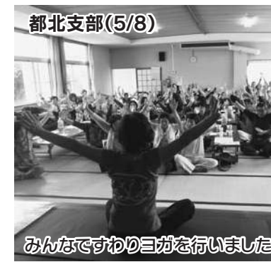
都北支部(5/8) みんなですわりヨガを行いました