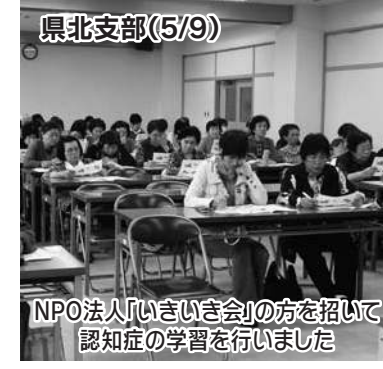
県北支部(5/9) NPO法人「いきいき会」の方を招いて認知症の学習を行いました