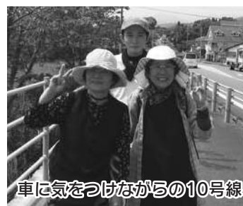
生協いきいき健康ウォーク in日向 会話をしながら楽しくウォーキング

毎年恒例の生協いきいき健康ウォークが4月18日、日向サンパーク公園にて開催されました。心配されていた天気にも恵まれ、絶好のウォーキング日和とあって約120名の多くの参加者で賑わいました。理学療法士によるストレッチ体操と正しい歩き方の話しでは歩く事で基礎代謝が上がり、筋力がついて健康な身体を維持できるとい