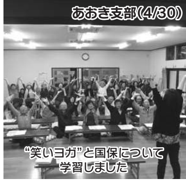
あおき支部(4/30) “笑いヨガ”と国保について学習しました