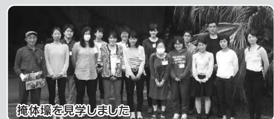
掩体壕を見学しました