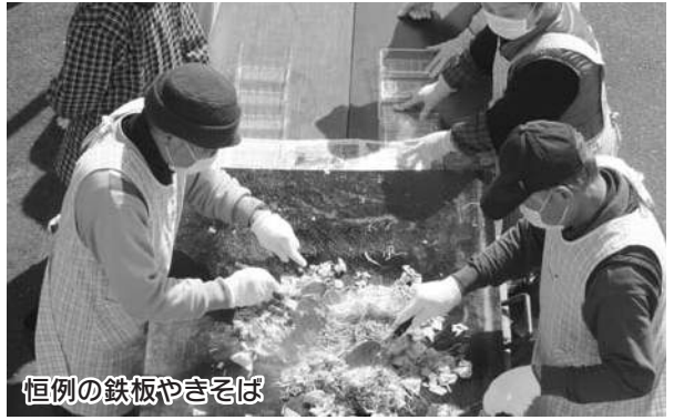
恒例の鉄板焼きそば

7月9〜10日、福岡県久留米市で開催の「九州沖縄ブロック組合員交流研修会」に向けて、各支部では財政活動に取り組んでいます。東部支部は3月13日、生協病院駐車場で焼きそばをつくり職員のみなさんに提供しました。研修会の費用は一人あたり約27,000円(参加費・旅費交通費など)がかかります。組合員のみなさん、支部の財政活動へのご協力をよろしくお願いいたします。 (九州沖縄ブロック組合員 交流研修会実行委員会)