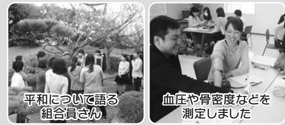
血圧や骨密度などを測定しました