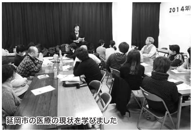
延岡市の医療の現状を学びました