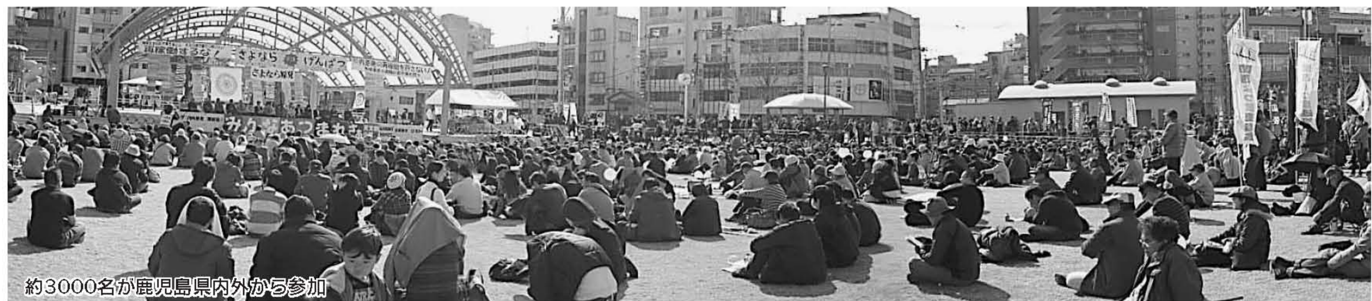
約3000名が鹿児島県内外から参加